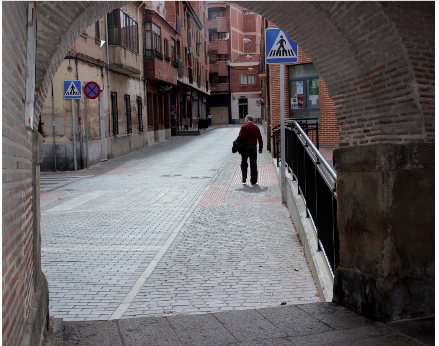
La acción política de Gana Medina: una puerta abierta a todos para cambiar la realidad.