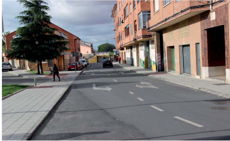
Mejora urbana en la calle Obispo Barrientos.

Somos conscientes de que en un año no se puede hacer todo. Quizás se pudo hacer algo más y no fuimos capaces de concretarlo. La administración a veces es lenta y hay muchos impedimentos. Queda pendiente mucho, pero de lo planeado nos duele sobre todo que no