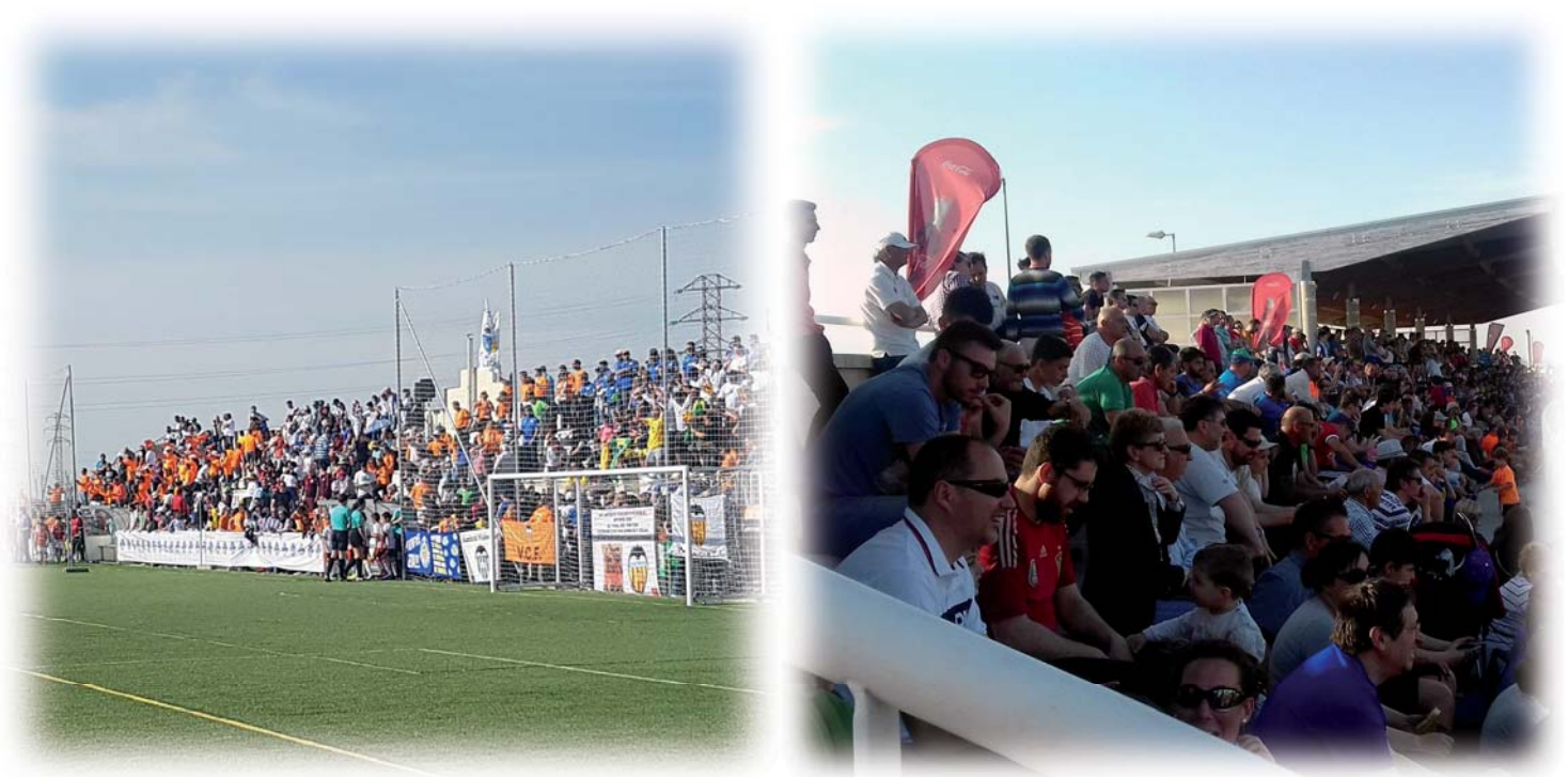
Las gentes de Medina disfrutan de los acontecimientos deportivos variados y de calidad.