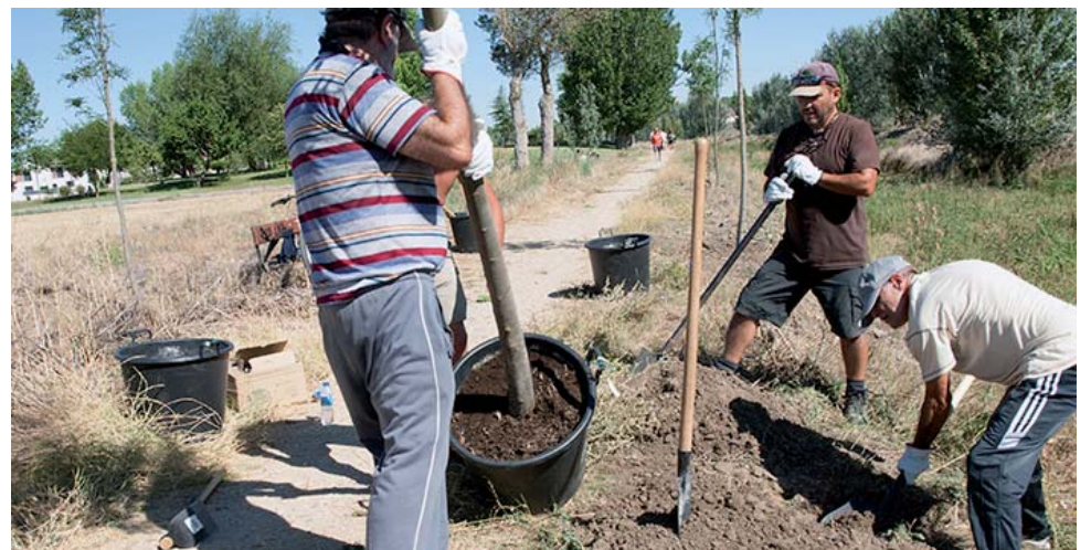
La colaboración ciudadana ayuda a cuidar y proteger nuestro entorno.