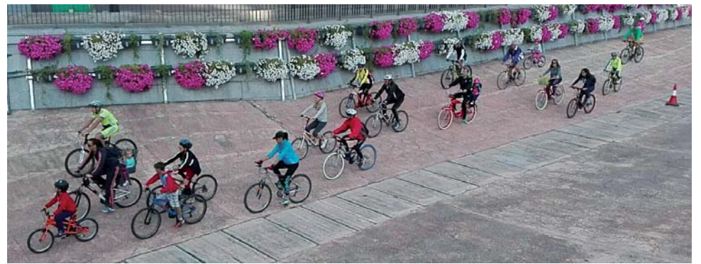
Vecinos paseando en bicicleta por el cauce del río Zarpadiel.