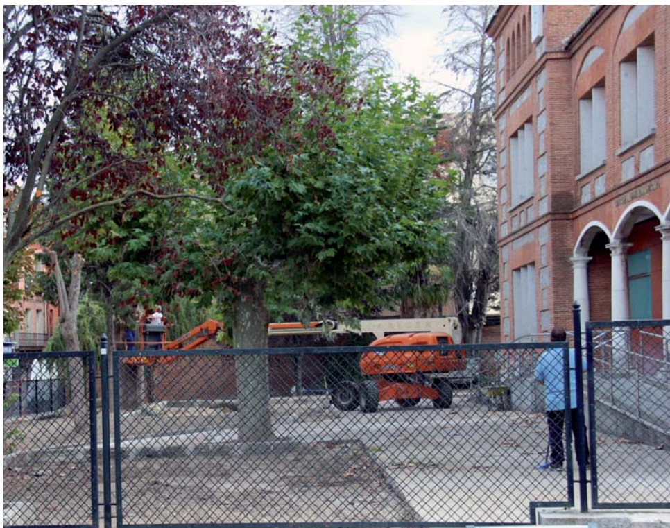
Obras de mejora en el ambulatorio.