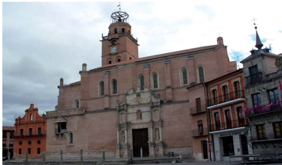
La moción no se refiere a edificios dedicados al culto, como la Colegiata.

Según la información fidedigna, contrastada y documentada oficialmente, en Medina del Campo hay 206 inmuebles que están exentos de la tributación del Impuesto de Bienes Inmuebles, la gran mayoría de ellos propiedad de la Iglesia Católica. De esos 206 inmuebles 49 no solo no tienen como finalidad el culto religioso sino que, además, sus propietarios les usan con distintos fines que les supone ingresos, es decir, es una actividad económica beneficiada además con la exención de la tributación urbanística, lo que supone un agravio comparativo injustificable con