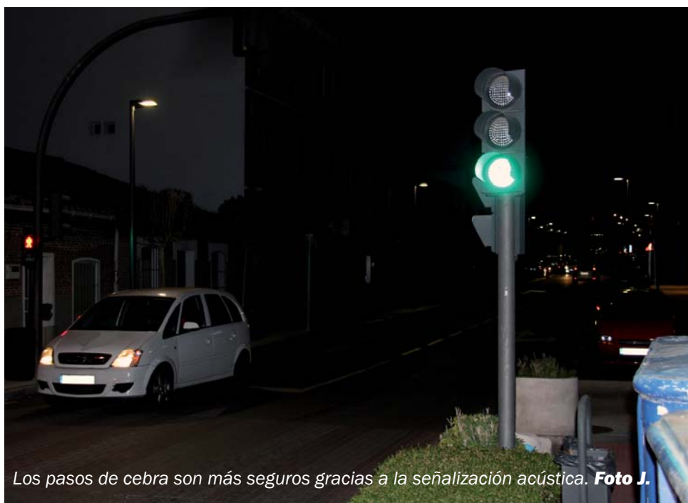
Los pasos de cebra son más seguros gracias a la señalización acústica.

La otra medida está pensada para influir por igual a peatones y conductores: se trata de la iluminación de pasos de cebra que se consideren especialmente peligrosos. Mejorando la visibilidad de esos pasos se refuerza la seguridad porque los peatones son más visibles cuando los cruzan, dando mayores posibilidades de que los conductores se percaten del paso de una persona por esos lugares señalizados.